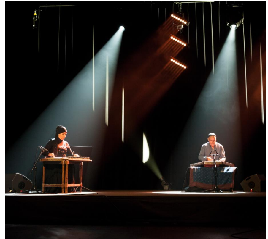
JM France © Meng Phu

Un spectacle de la compagnie Ecouter Voir