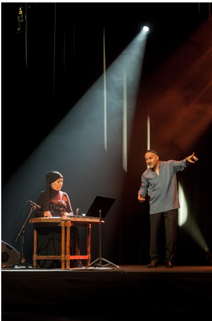
JM France © Meng Phu